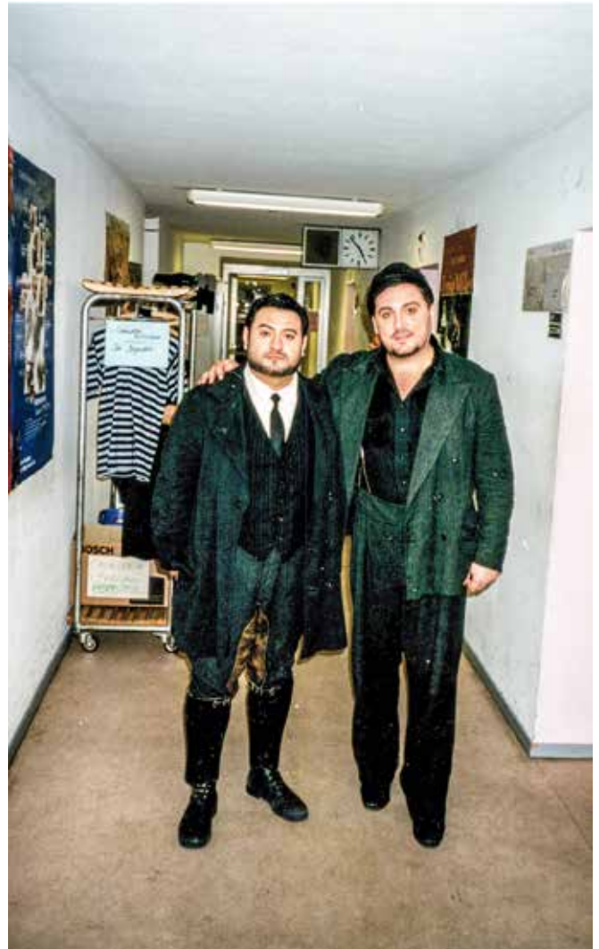
Кавалерија рустикана, Франкфурт, са К. Алмагером

видљиво и у резултатима његових студената.