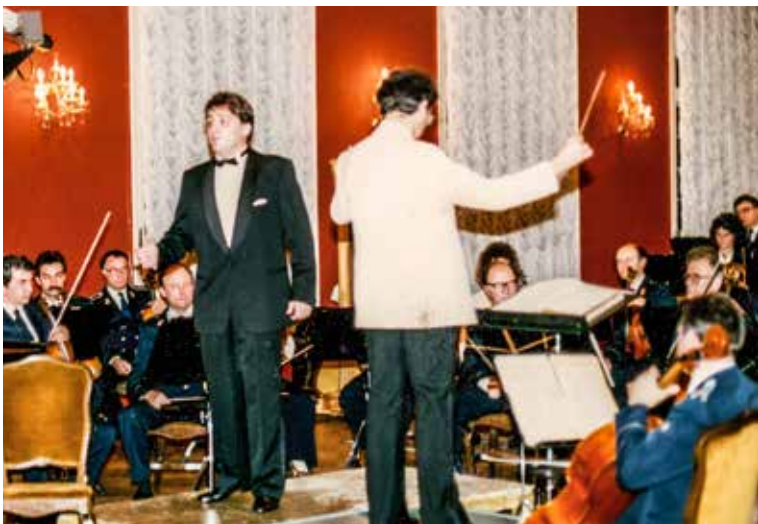
Први јавни наступ са оркестром ЈНА, 1987.