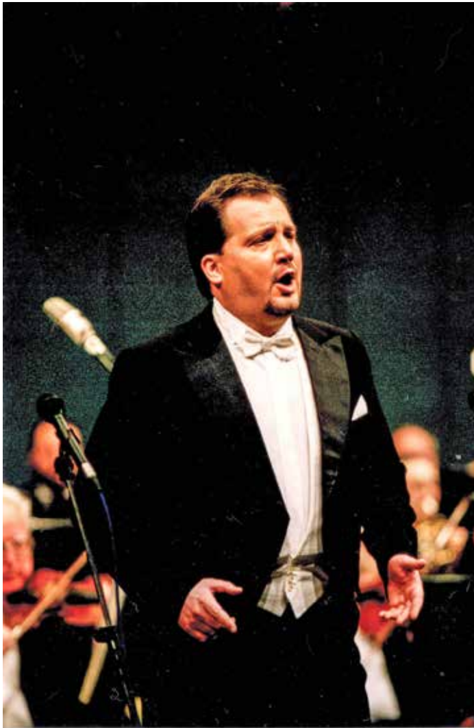
Концерт, Сава центар