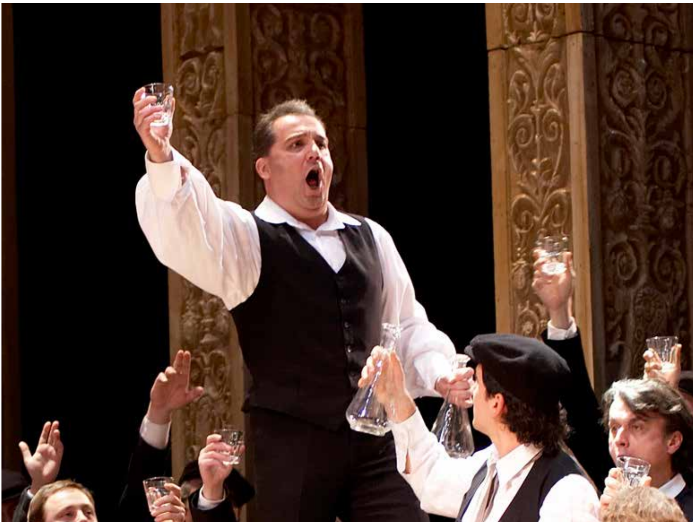
Кавалерија рустикана, Народно позориште у Београду